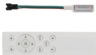
Controlador para tira de LED digital de un color DIGC1RF

Al apagarse, ocurre lo contrario: la luz "retrocede" en dirección inversa y los segmentos que deja atrás permanecen apagados.